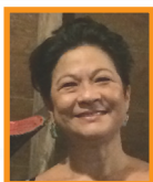
SCHUTZ Florence METEO/SG-LOG